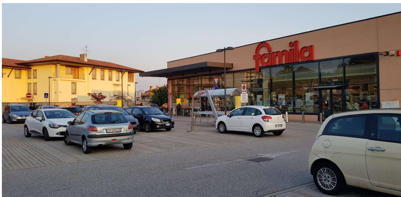
Vista dell'ingresso del Famila