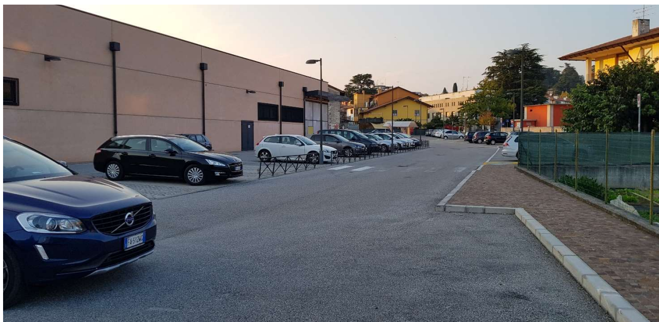
Vista del Famila e del parcheggio adiacente dal lato est