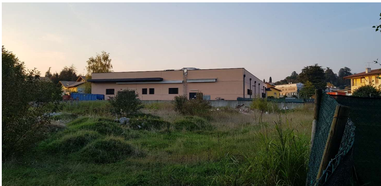
Vista del Famila dal lato sud