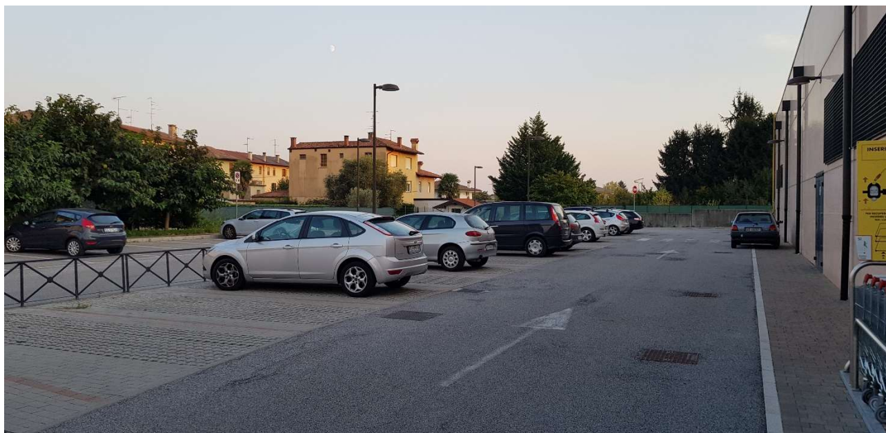
Vista del parcheggio adiacente al Famila da nord