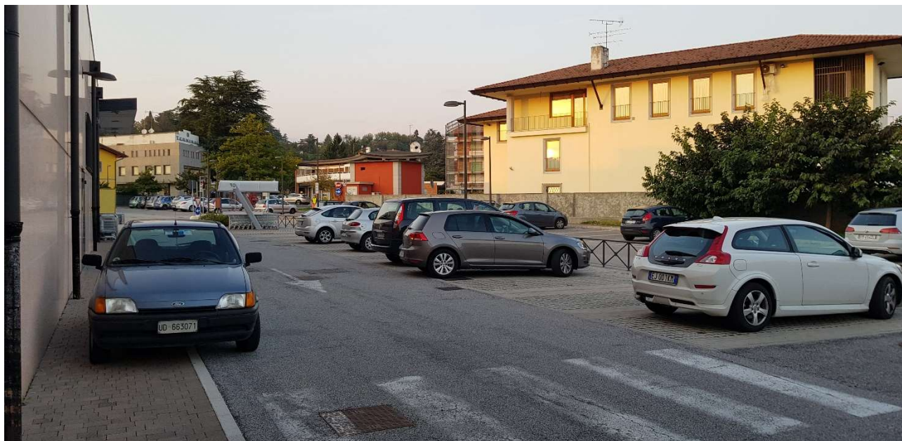
Vista del parcheggio adiacente al Famila da sud