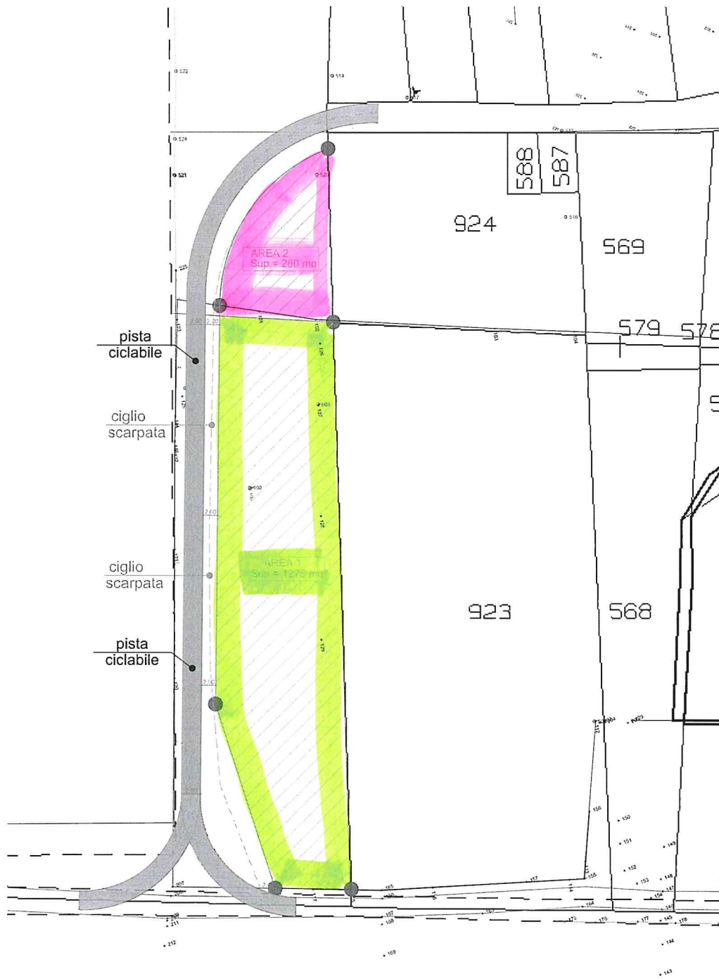
Schema superfici da cedere Scala 1:500