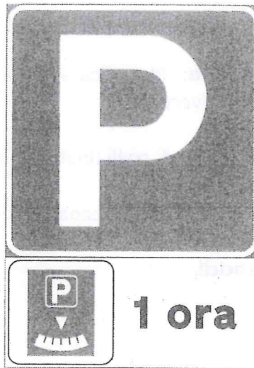
Figura 2. Segnaletica verticale della sosta limitata

Tale tipologia presenta limiti temporali, identificati dall'apposita segnaletica verticale (zona disco orario).