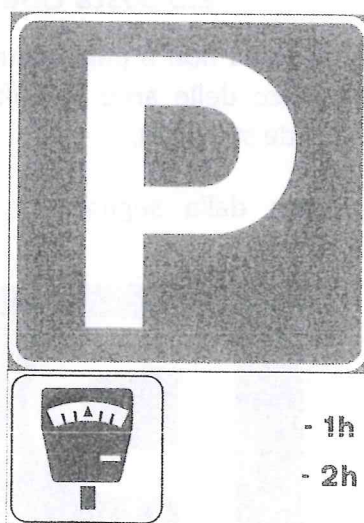
Figura 1. Segnaletica verticale della sosta a pagamento

Le aree di sosta a pagamento sono identificate con la segnaletica orizzontale di colore blu e concentrate solamente nella Zona 1.